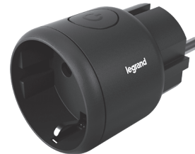
6 946 80