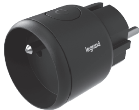
0 506 90