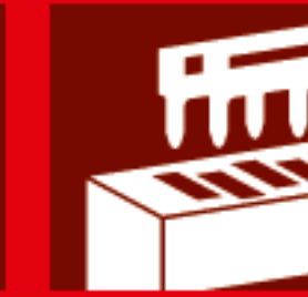
Raccordement par peigne