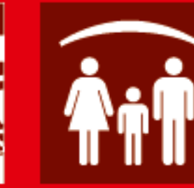
Protection des personnes